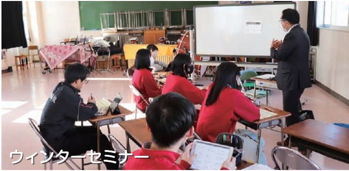
ウィンターセミナー