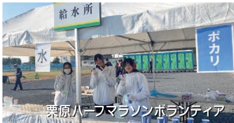
栗原ハーフマラソンボランティア