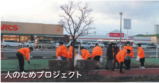
人のためプロジェクト

1年間の生活を振り返り、気分を一新して新たなスタートを切るときです。具体的な目標を設定し規則正しい生活を送りましょう。なお、アルバイト・原付バイク免許取得（通学希望のみ）・自動車免許取得（3年生）については申請が必要です。