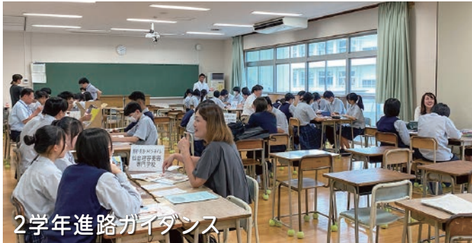
2学年進路ガイダンス