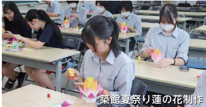
築館夏祭り蓮の花制作