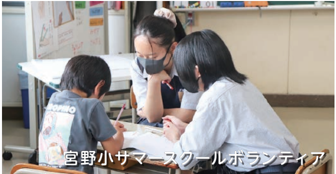
宮野小サマースクールボランティア