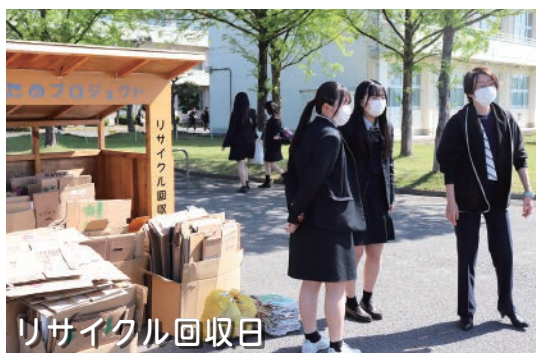
リサイクル回収日