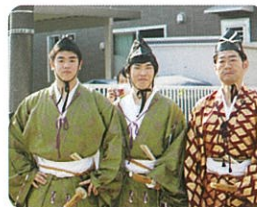
地域伝統行事ボランティア