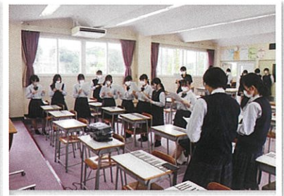
震災復興歌「明日の君へ」を練習