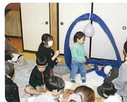
子ども食堂ボランティア