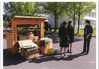
リサイクル品の回収