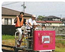
レールバイクボランティア