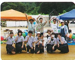
マインパーク夏祭りボランティア

築館高校は地域貢献を目的とし、ボランティア活動を積極的に展開しています。自分探し・社会勉強の絶好の機会です。地域のため、自分のためにできることを探してみませんか。令和6年度より従来の「部活動 [築ボラ部]」ではなく、有志生徒による自主的な取り組みとして新たな名称「ボランティアプロジェクト」のもと活動を展開しています。