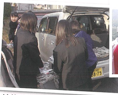
リサイクル品回収