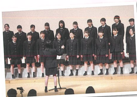
応援歌プロジェクト