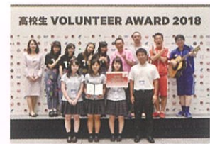
ボランティアアワード