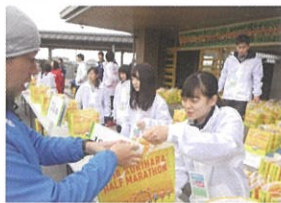
栗原ハーフマラソン