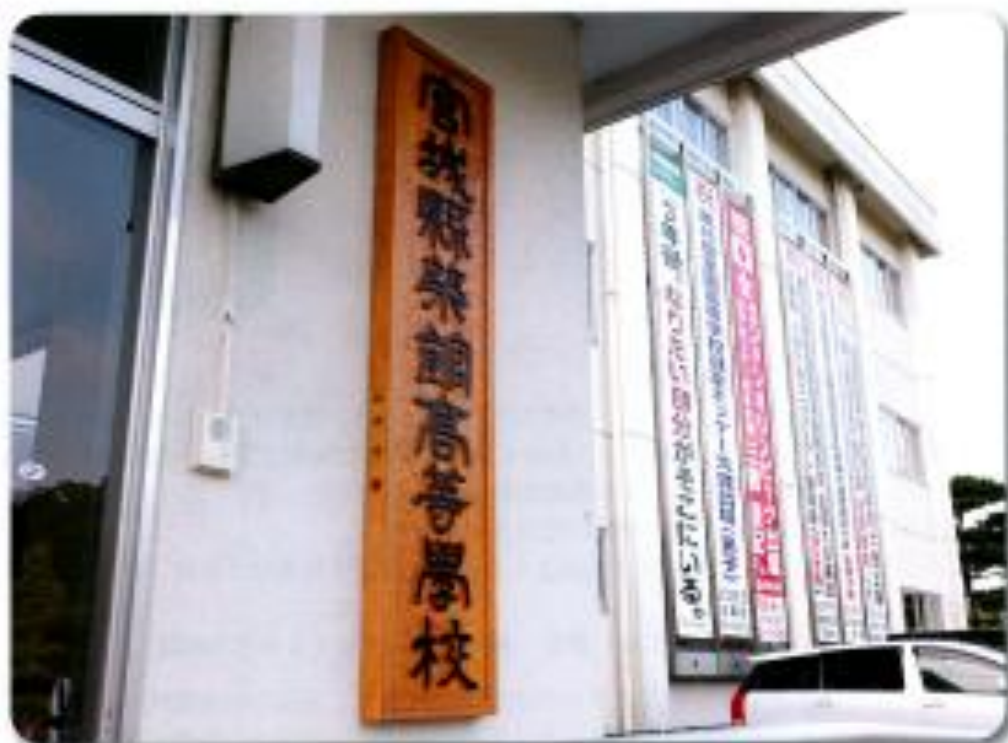
旧築館高等学校の銀杏の銘木を使用し校名板を作成 (築館高校6回生 岡崎 勇 殿)