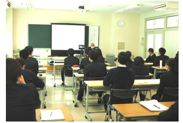
各クラス2名ずつ講義室で聴講しました