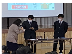
現金払いとキャッシュレスの違いを体験しています