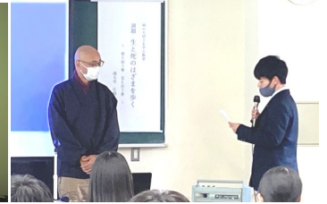
生徒会長がお礼を述べました