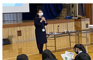
全生徒に資料が配られ、説明を聞きました